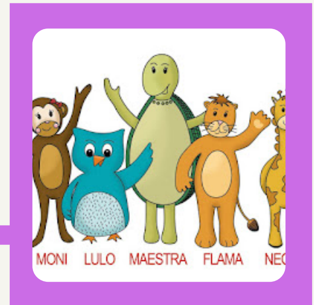
MONI LULO MAESTRA FLAMA NECO

VEN A NUESTRO COLE ¡SIENTE, DISFRUTA, EMOCIÓNATE, APRENDE...VIVE!