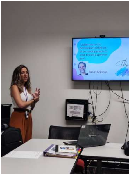
Presentación plan actuación

una experiencia muy enriquecedora en muchos ámbitos y con la posibilidad de compartir con todos los miembros de la comunidad educativa.