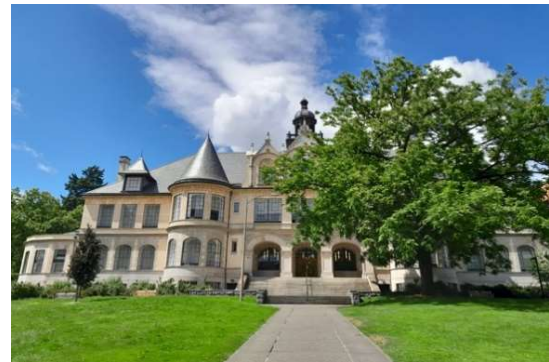
Campus Universidad de Washington

Para conseguir cumplir con todos estos objetivos, comenzamos nuestra formación durante las dos primeras semanas de julio a través de sesiones online. En estas sesiones pudimos conocer tanto a las coordinadoras y profesionales en educación de la Universidad de Washington con las que