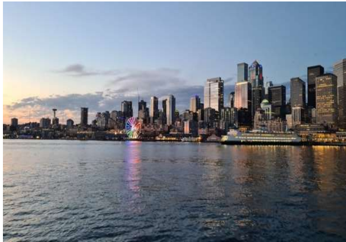
Skyline en Seattle